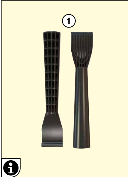
i Das Aufbiegewerkzeug ermöglicht das schnelle Anbringen an die Regalstütze.