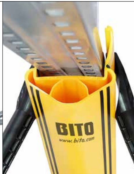
2 Regalschutz über die Regalstütze stülpen und an die gewünschte Position drücken.